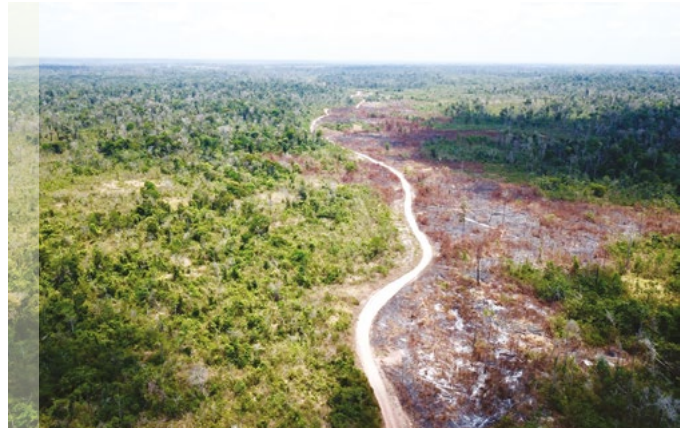
Forêts amazoniennes dégradées par le feu, municipalité de Paragominas, État du Para, Brésil

Dans le cadre du RDUE, la méthodologie proposée offre un outil opérationnel pour évaluer l'éligibilité des surfaces forestières à l'exportation vers l'UE, en s'appuyant sur une définition élargie de la dégradation. Appliquée au Cameroun (voir figure 2 page suivante), elle distingue huit types forestiers et écosystèmes boisés, et permet d'identifier,