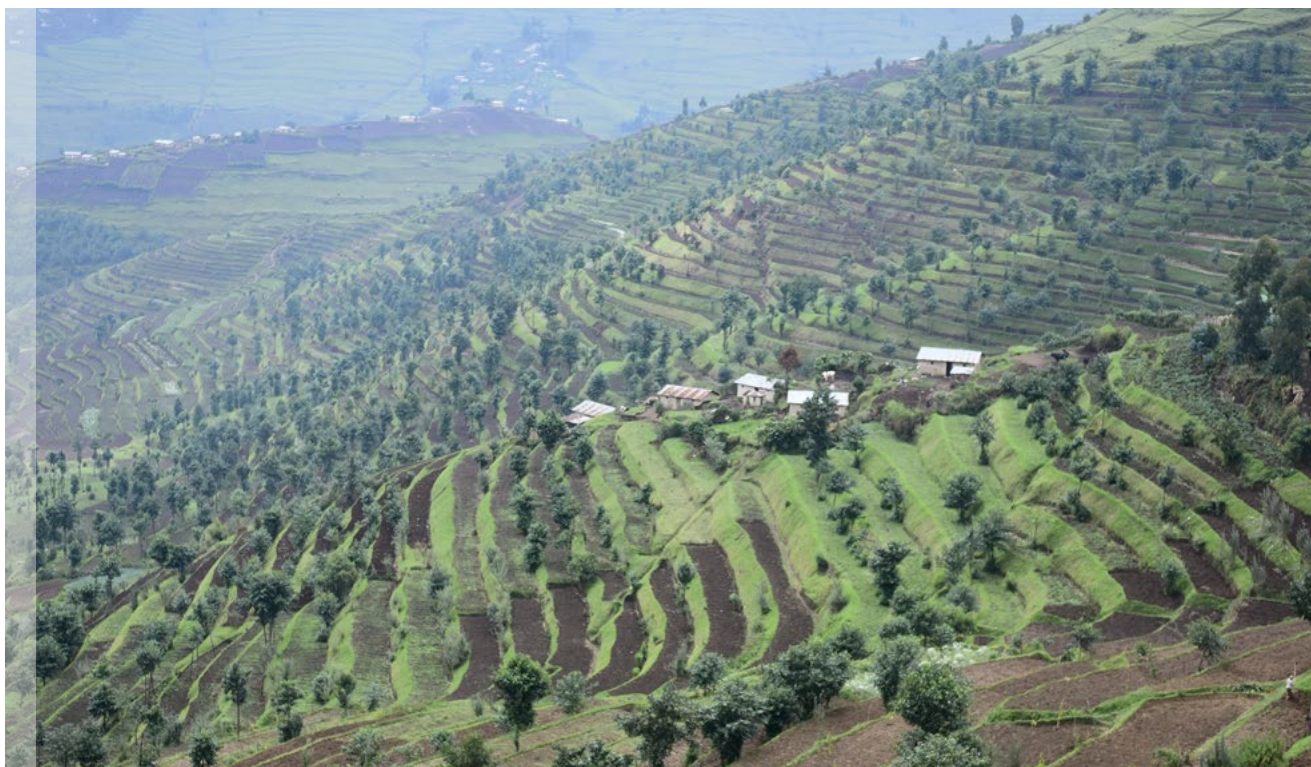
Paysage agroforestier en terrasse, Rulindo, Rwanda