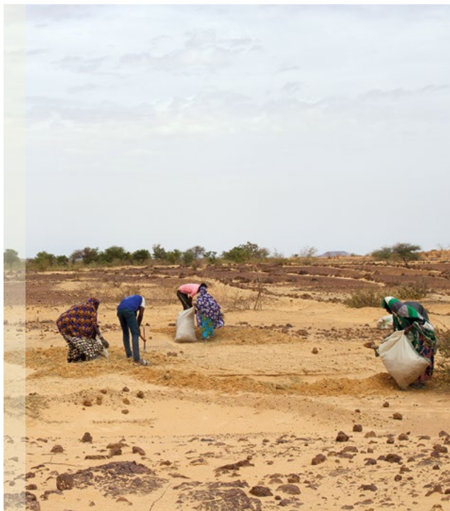
Villageois plantant des arbres dans le cadre d'un projet de restauration, Tillabéri, Niger (FLRM, FAO, 2021)