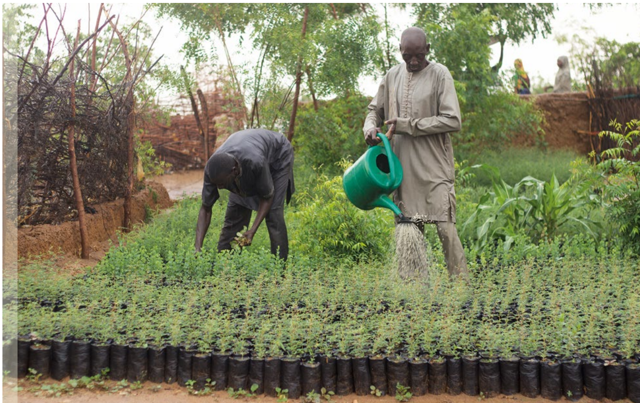
Paysans arrosant une pépinière forestière, Tillabéri, Niger (FLRM, FAO, 2021)