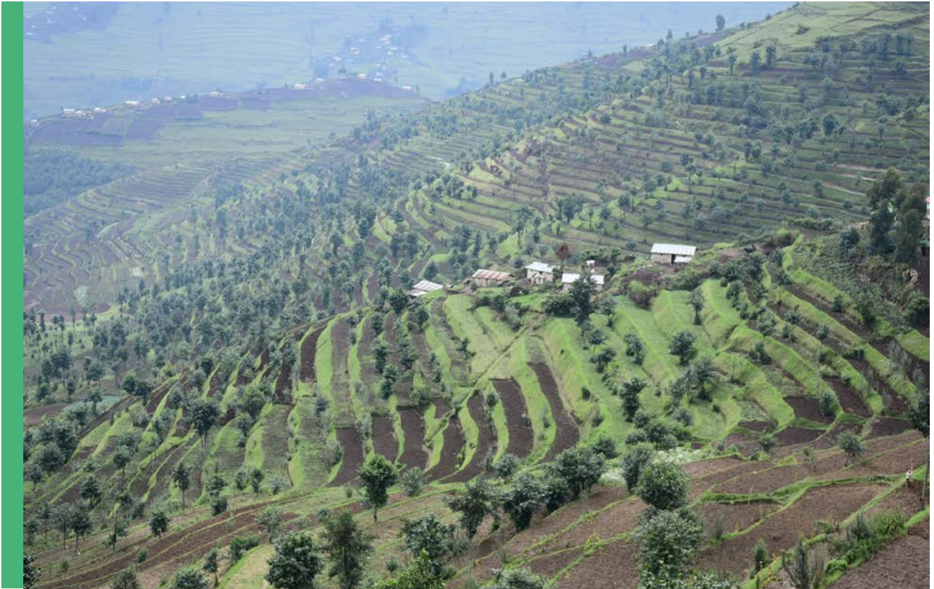
Paysage agroforestier en terrasse, Rulindo, Rwanda