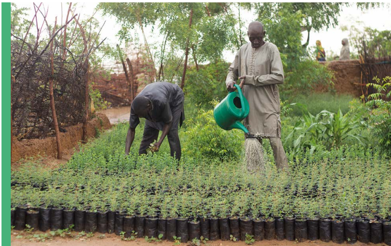
Paysans arrosant une pépinière forestière, Tillabéri, Niger (FLRM, FAO, 2021)