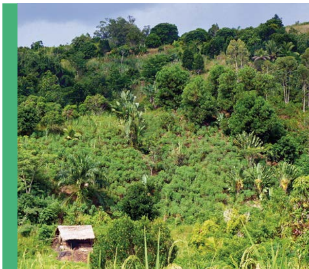
Systèmes agroforestiers à base de girofliers, Fénéry, Madagascar

Les plantations forestières et agroforestières peuvent ainsi trouver toute leur place dans les programmes de RPF, en complément des formations forestières « naturelles ». La diversité des espèces forestières utilisables en plantations et des produits et services qu'elles fournissent peuvent en effet bénéficier notablement aux populations locales et aux filières concernées. Renforcer les fonctions de production dans le cadre de la RPF, c'est aussi contribuer à diminuer la pression sur les formations « naturelles » et contribuer aux stratégies de lutte contre la déforestation. Intégrer la restauration des fonctions de production dans les stratégies de RPF est donc important afin que celles-ci répondent aux attentes des acteurs locaux et contribuent aux actions de développement. Restaurer des écosystèmes et agroécosystèmes « productifs », c'est aussi rendre les actions de RPF acceptables, voire attractives pour les acteurs locaux, et contribuer à la durabilité de ces actions, avec un ciblage privilégié vers les productions paysannes ou villageoises, et non pas au sein de complexes agroforestiers de type industriels.