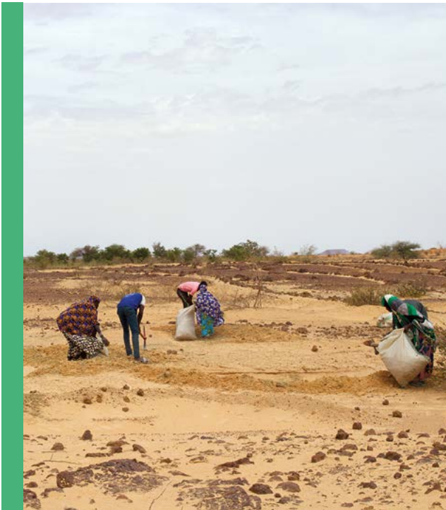
Villageois plantant des arbres dans le cadre d'un projet de restauration, Tillabéri, Niger (FLRM, FAO, 2021)