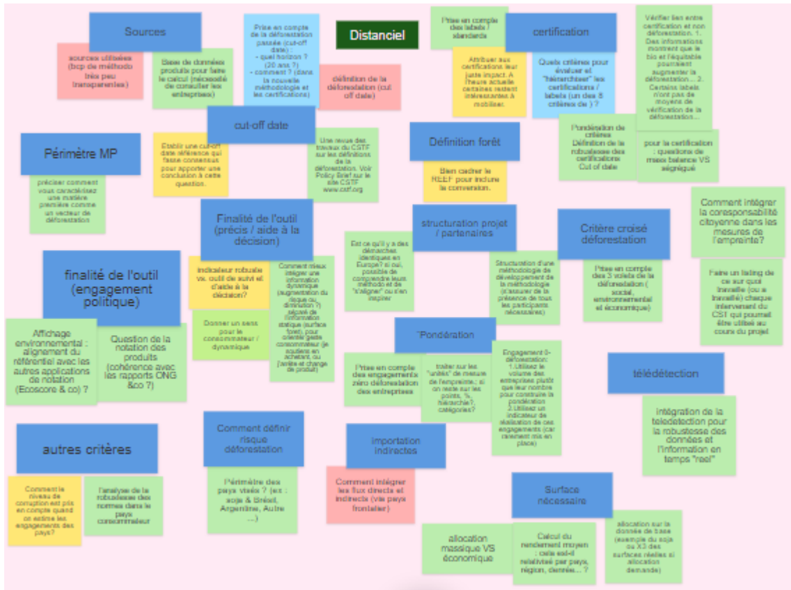
Capture d'écran du premier atelier REFF : Post-it des thèmes à traiter pour le groupe en distanciel.